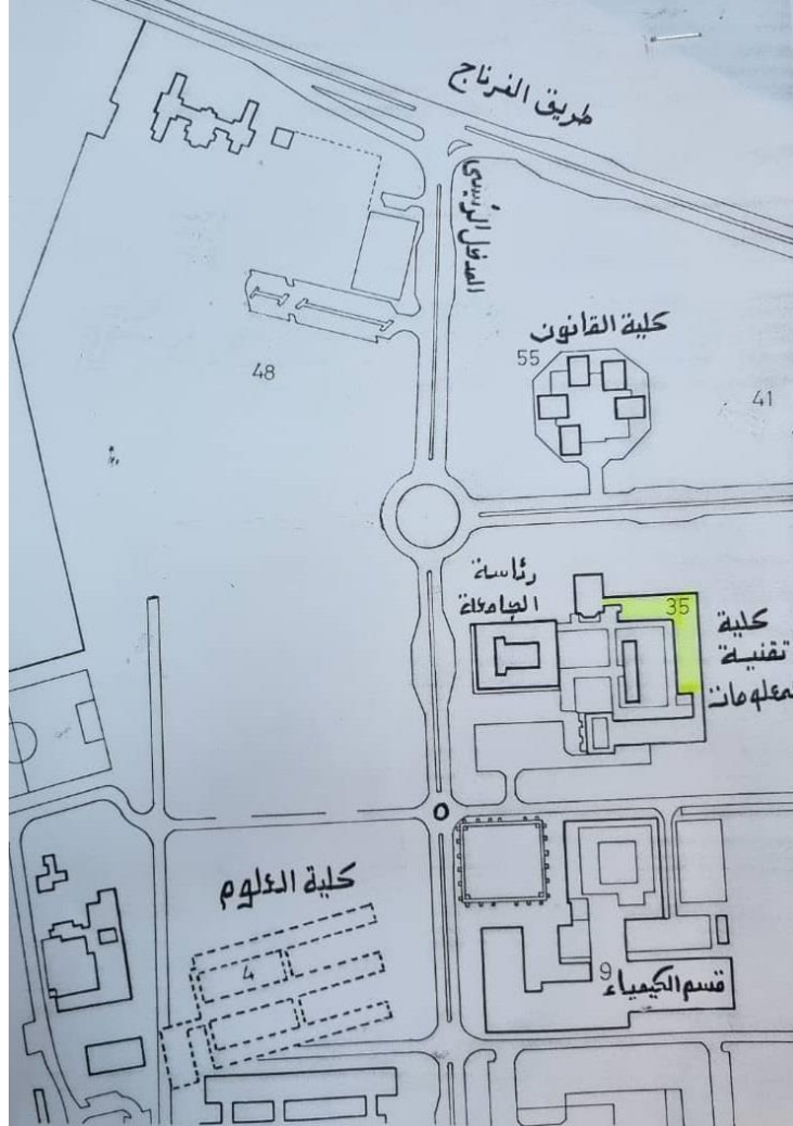
الشكل 1: رسم هندسي يوضح موقع كلية تقنية المعلومات

كلية تقنية المعلومات بجامعة طرابلس، تقع داخل الحرم الجامعي (المركب الرئيسي). الشكل رقم 1 رسم هندسي يوضح موقع كلية تقنية المعلومات وتبلغ مساحتها حوالي 4000 م